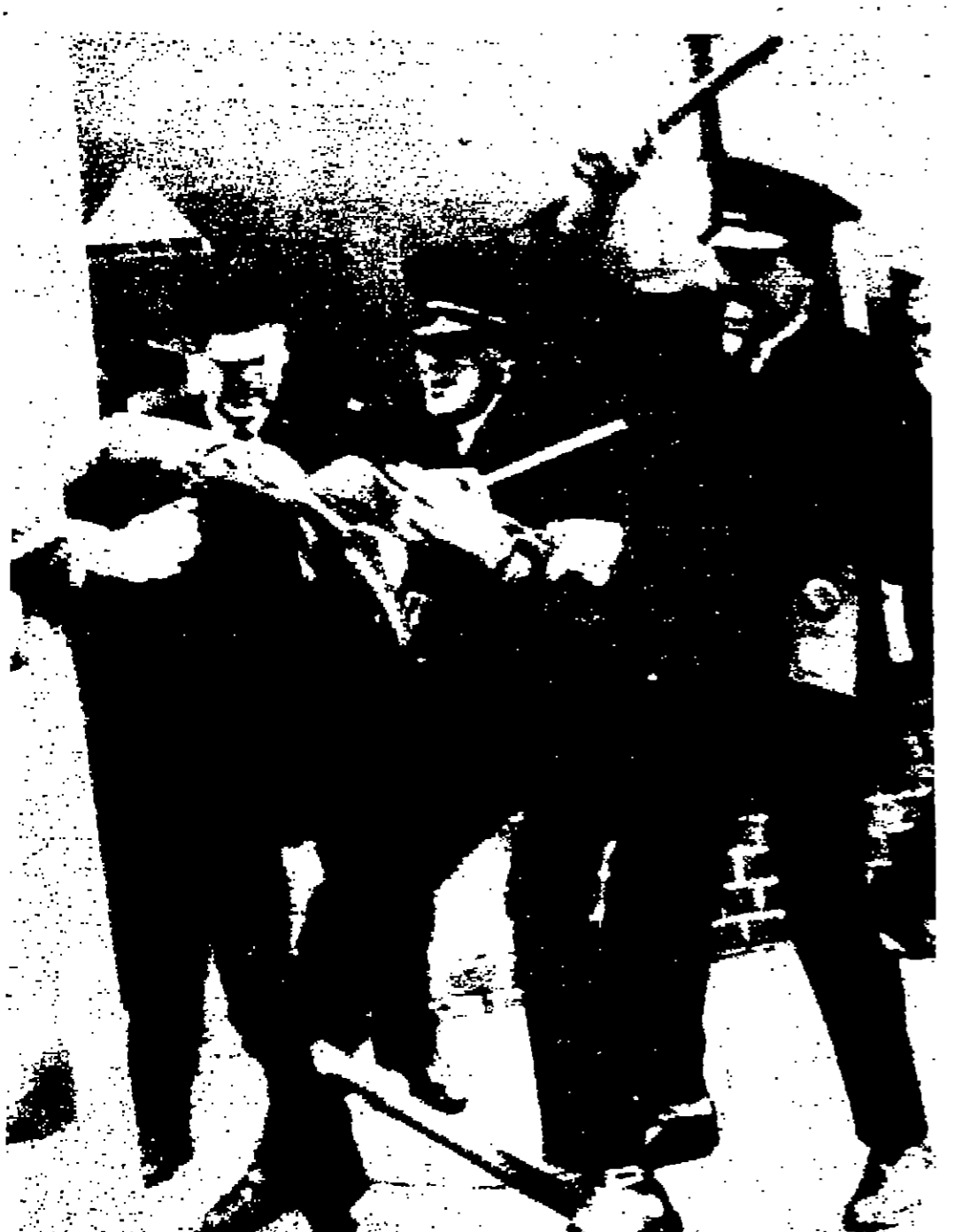
اطلق ثلاثة من رجال البوليس المنحلين لراواتهم في مظاهرة جرت نسي قننيري في ايراده الشمالية مطالبه بنفي نظام الانتفاضة، والاحتجاج على التمييز الديني، وقامت مظاهرة احتجاجية في اليوم التالي احتجاجا على وسائل العنف التي اجا لها البوليس تصوير اليونانيديرس

ان ابا ايهان يدرك جيدا: ان كنهه السلام مفرومة سلفا من الدول العربية، وانها مجرد «مخورة» لاجل بوس اسرائيل ان تنجح من ادانة الرأي العام الدولي لها بقها المموله من تمويل جهود السلام واحباط مهمة الكورس باريف. ولعل اوضح دليل على معرفة ايهان (ويونسن) ببرد الفعل العربي المتقلد شرع السلام الإسرائيلي هو ان الرئيس جونسن لم يكلف نفسه مشقة انتظار رد الفعل العربي، بل سارع الى التصرف على اساس انه سيكون سلبي، وافان امسى من فضع بابا القوضت مع اسرائيل تسليها طائرات القنوم 1.